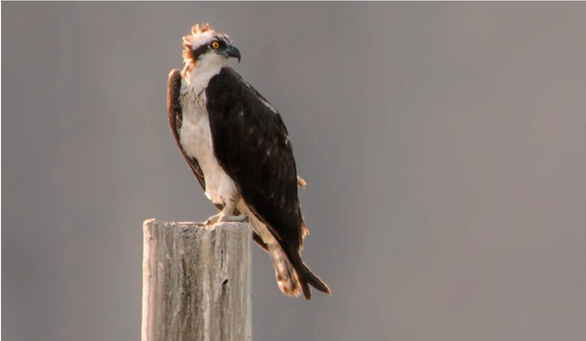
Foto 1. Primera evidencia concreta de P. haliaetus para la provincia de San Juan. Ejemplar adulto fotografiado en el Parque Natural Provincial Presidente Sarmiento, departamento Zonda, el 24 de enero de 2019.