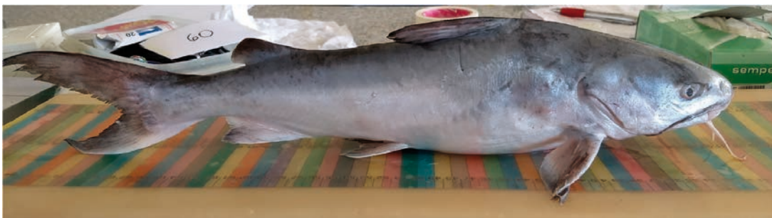
Foto 1. Ejemplar de Genidens barbatus .