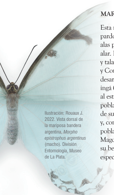
Ilustración: Rouaux J. 2022. Vista dorsal de la mariposa bandera argentina, Morpho epistrophus argentinus (macho). División Entomología, Museo de La Plata.