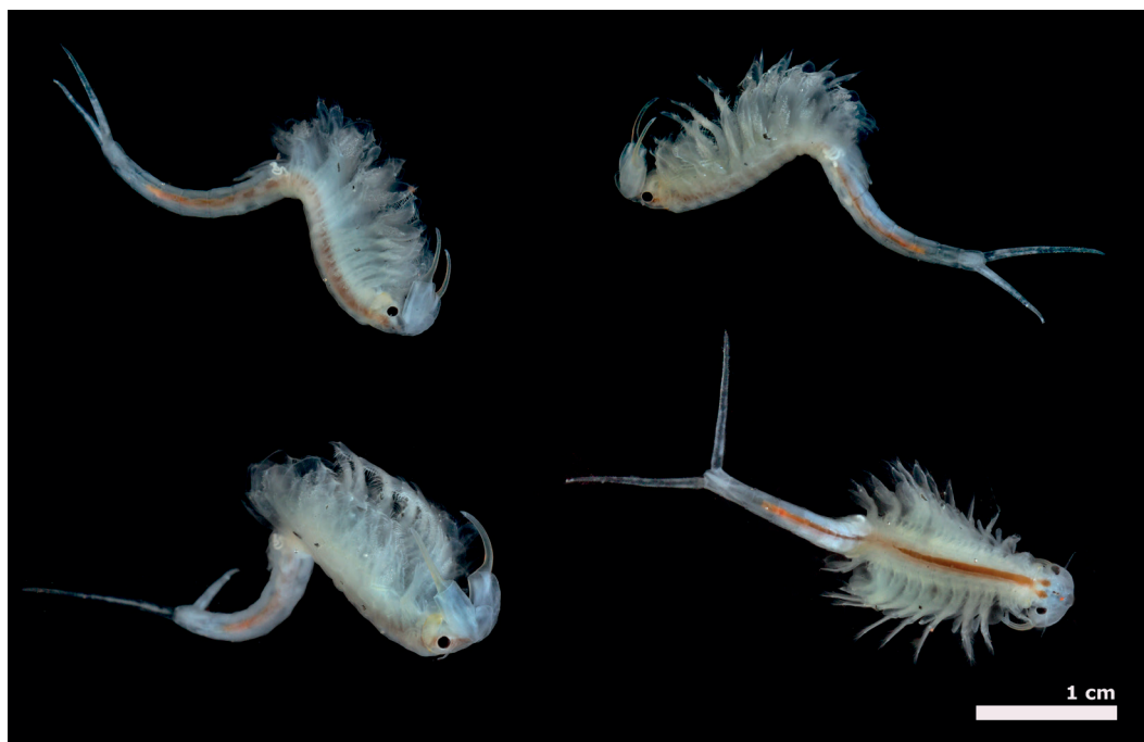
Figura 1 - Aeginecta longicauda macho localidad tipo. Fotos: Darío Podestá (Laboratorio de Fotografía, CONICET-CENPAT).

Argentina aun es escaso para este particular grupo de crustáceos esto puede deberse a su particular forma de vida y a que los muestreos históricos han sido ocasionales y oportunisticos. Este hecho está apoyado por la gran cantidad de información y novedades distribucionales que se generaron en los últimos años (Pérez, 2019 a, b y c, 2024; Rogers et al. 2020; García et al. , 2023) como así también la descripción de especies nuevas (Cohen, 2002, 2008, 2016) o incluso un nuevo género monotípico de la familia Thamnocephalidae (Rogers et al. , 2018). La familia Thamnocephalidae está compuesta por siete géneros y 76 especies (Rogers, 2006, 2013; Rogers et al. , 2018) de los cuales cuatro géneros y ocho especies están presentes en Argentina (Rogers, 2013; Rogers et al. , 2018; Cohen, 2016). Aeginecta longicauda (Figura 1 y 2) fue descrita para Bajo de los Huesos, departamento de Rawson, Chubut, Argentina, única localidad conoci-