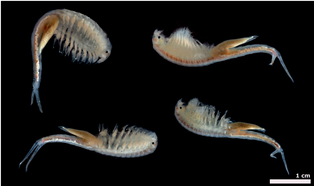
Figura 2 - Aeginecta longicauda hembra localidad tipo.

da para la especie, en base a un único individuo macho depositado en el Museo de La Plata, La Plata, provincia de Buenos Aires, Argentina (Rogers et al. , 2018).