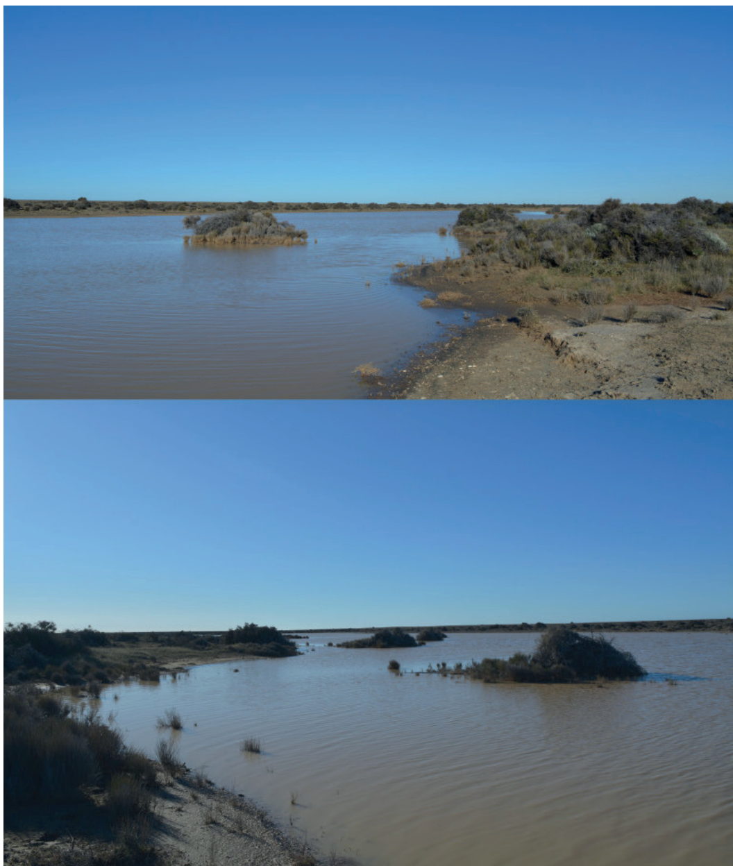
Figura 5 - Ambiente en la localidad tipo de Aeginecta longicauda .

la asociación fue con una segunda especie de notostraco, Lepidurus patagonicus y nuevamente con Branchinecta valchetana (Pérez, 2019 a y c). En ambas ocasiones, además,