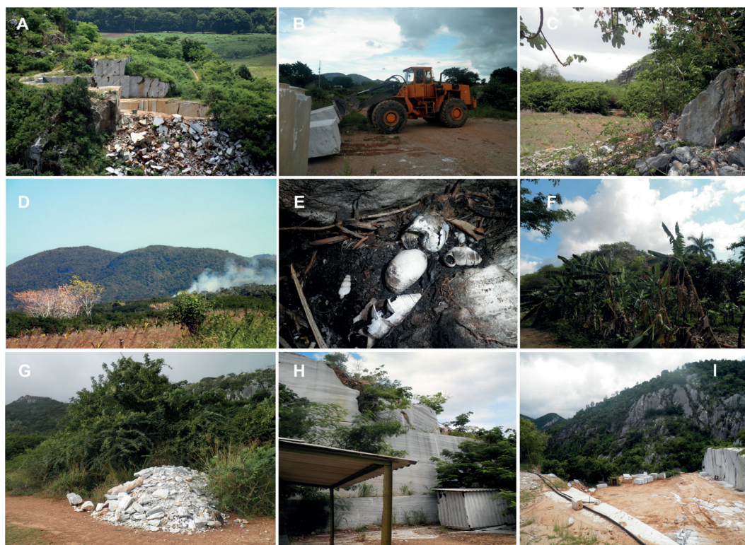
Figura 2 - Amenazas que presentan los moluscos terrestres en la IJ. A, H e I: Vistas de la cantera para la extracción de mármol ubicada en Sierra de Casas. B: Extracción de bloques de mármol en las canteras de las sierras del norte pinero. C y G: Desechos de la explotación de las canteras de Sierra Colombo y Sierra de Caballos respectivamente. D y E: Incendios forestales que provocan serias afectaciones en la malacofauna terrestre por ser un grupo con baja capacidad dispersión. F: Prácticas agrícolas inadecuadas como plantaciones de plátanos en Sierra Colombo.

la malacofauna pinera en sus revisiones taxonómicas (Morelet, 1849; Torre y Bartsch, 1938, 1941; Aguayo y Jaume, 1954; Jaume, 1954a, 1954b; Clench y Jacobson, 1970, 1971; Jaume y de la Torre, 1976) o han adicionado elementos nuevos (Perera y Young, 1984; Perera et al. , 1984). Desde el 2015 han sido publicados también diversos listados de especies terrestres, llamados de alerta en conservación de poblaciones endémicas, nuevos registros de localidades y nuevas especies para la ciencia (Herrera-Uria, 2015a; 2015b; 2015c; Herrera-Uria, 2016a; 2016b; Herrera-Uria, et al. , 2016; Herrera-Uria y Espinosa 2016a, 2016b y 2016c; Espinosa y Herrera-Uria 2016a, 2016b; Herrera-Uria, 2017).