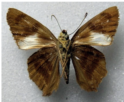
Figura 20- Telegonus cretatus adoba (Faz ventral). San Antonio (Misiones).

cho más común en Misiones. No obstante algunos ejemplares son en realidad T. cretatus adoba . Uno de ellos procede de la localidad de San Antonio (departamento Gral. Belgrano), recolectado por el autor el 12/12/1996 y hay otros dos ejemplares, uno de ellos de Apóstoles y el otro de "Misiones" (MACN). Se diferencia de T. creteus siges básicamente en que la mancha blanca del tornus de alas anteriores en faz ventral es de mayor extensión y en que las líneas oscuras discales de alas posteriores son ligeramente más anchas (Fig. 20). Conocida del sur de Brasil (Warren et al., 2024) y presente en el Parque Nacional do Iguazu, Paraná, Brasil (Greve et al., 2023). Anteriormente en el género Astraptus .