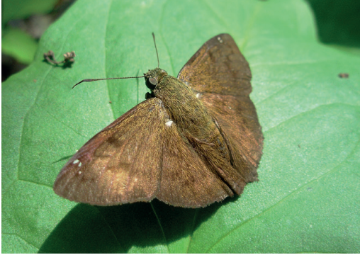
Figura 21- Telemiades nicomedes . Campo Ramón (Misiones).

Misiones), el cual fue fotografiado in situ el 26/11/2009 (Fig. 21). Conocida de Argentina y sur de Brasil (Siewert et al. , 2010).