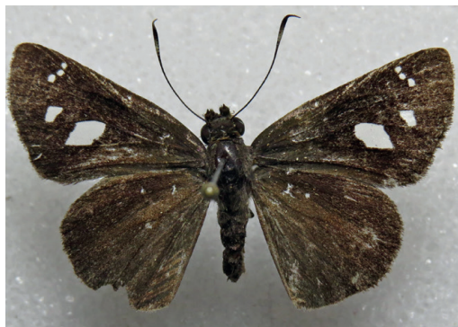
Figura 25- Lamponia lamponia (♀). Reserva Privada Itaovy (Misiones).

Un ejemplar ♀ fue recolectado en la Reserva Privada Itaovy (departamento Guaraní, Misiones) el 11/2/2025 en helechales húmedos del borde del camino de acceso (Fig. 25). Se trata de género y especie inéditos para Argentina. Solo era conocida para Brasil (Warren et al. , 2024).