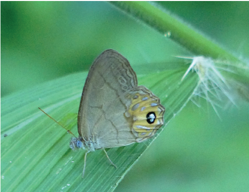
Figura 17- Argentaria hygina . Parque Provincial Caá Yará (Misiones).

Argentaria pagyris : Misiones: Parque Provincial Piñalito, 15/8/2015; Don Enrique Lodge, Paraje La Bonita, 2/1/2019. Hay dos fotografías más de dos ejemplares en la zona del Parque Provincial Caá Yará en ArgentiNat (2025). Todos estos registros son del extremo este de Misiones, es decir, de la ruta nacional 14 hacia al este, en la zona más alta y quebrada de la provincia. En cambio, A. hygina se halla mejor distribuida en la provincia. Solo se conocía previamente de Brasil (Warren et al. , 2024) pero seguramente siempre estuvo en el área.