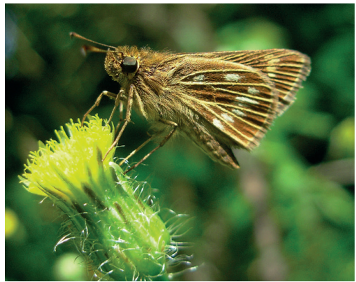
Figura 28- Nastra celeus vetus . Campo Ramón (Misiones).

Un ejemplar de Chacra Mariposa (Campo Ramón, departamento Oberá, Misiones) fue fotografiado por el autor el 25/9/2010 (Fig. 28) creyendo se trataba de Vehilius stictomenes (A. Butler, 1877), una especie muy habitual en la provincia, por ello no fue recolectada. Existe en ArgentiNat (2025) un registro fotográfico reciente en Posadas (Misiones). Se trata de un nuevo registro nacional, la cual solo se conocía del estado de Paraná, Brasil (Warren et al. , 2024). Hallada en el Parque Nacional Iguazú, Parana, Brasil (Greve et al. , 2023). Es una especie que se esperaba hallar en el país, por ello fue incluida en el anexo en Klimaitis et al. (2018), pero hasta el momento no contaba con registros concretos. Anteriormente en el género Vehilius .