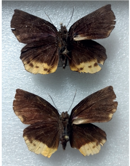
Figura 22- Achlyodes busirus rioja (arriba) y A. calvus (abajo) de Iguazú (Misiones).

camente distinta. Se trata de un carácter que no puede ser visto en el campo, solo con ejemplares recolectados y en el caso de los machos. Las hembras de ambas especies son indistinguibles y solo pueden ser determinadas mediante genitalia o genómica (Zhang et al. , 2023). De todos modos, a juzgar por los ejemplares recolectados de ambas especies en la colección del MACN, A. busirus rioja es mucho más común en Misiones. En Iguazú ambas especies vuelan juntas. (Fig. 22)