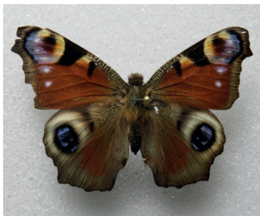
Figura 13- Aglais io . CABA.