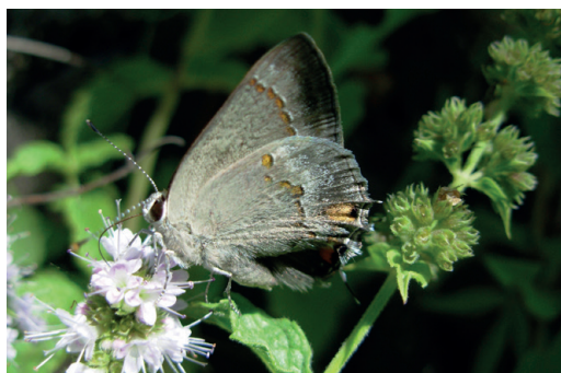
Figura 5 - Strymon eremica . Villa Carlos Paz (Córdoba).