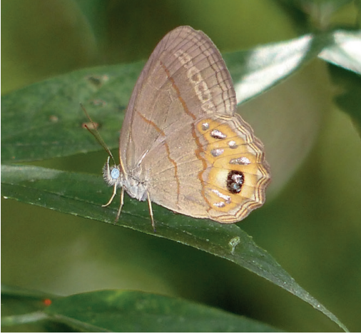
Figura 16- Argentaria pagyris . Paraje La Bonita (Misiones).