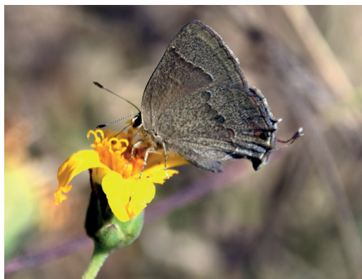
Figura 4 - Strymon veterator . Las Padercitas (La Rioja).