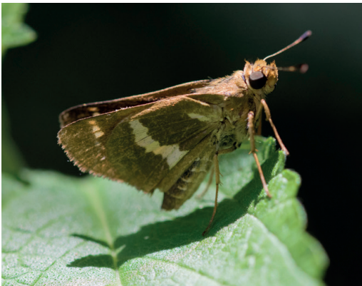
Figura 27- Metron fasciata (Faz ventral). Puerto Ocampo (Santa Fe).

que el primer nombre era considerado un sinónimo. Viendo las figuras en Warren et al. (2024), el ejemplar fotografiado en Santa Fe coincide en su diseño mucho más con fasciata . Habría que realizar más muestreos en esa zona tan interesante del norte santafesino para localizar y recolectar más ejemplares de esta especie de la que hay muy pocos datos en la bibliografía en general, sobre todo en Sudamérica austral.