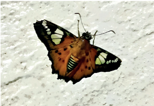
Figura 32- Agara pardalina yacutinga . Reserva Privada Yacutinga (Misiones).

Un ejemplar ♂ de esta rara subespecie fue registrado en la Reserva Privada Yacutinga (Misiones) el 11/2/2024, a las 20:28 hs, en el lobby del hotel, adonde había entrado por error o atraído por las luces (Fig. 32). Cabe aclarar que no se la veía en la reserva desde el año 2007, cuando fueron recolectados la mayor parte de los ejemplares que sirvieron para describirla (Núñez Bustos, 2008; Mielke y Casagrande, 2011). La presente foto es hasta ahora la única in situ que se le ha tomado en el país. Adicionalmente a ello, en la selva Yriapú, cercana a Puerto Iguazú ha sido hallado un ejemplar en octubre de 2023 (depositado en el MACN) y también fue registrada recientemente en el Parque Nacional do Iguazu, Parana, Brasil (Greve et al. , 2023). Anteriormente en el género Myselus . Conocida de Argentina, Paraguay y sur de Brasil (Klimaitis et al. , 2018; Mielke et al. , 2022).