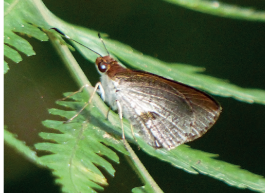
Figura 30- Psoralis sabina (Faz ventral). Reserva Privada Yaguaroundí (Misiones).

Esta especie había sido citada recientemente (Núñez Bustos, 2023a) de Piñalito Sur (Misiones) en base a un registro de ArgentiNat (2025) donde hay ahora otras dos imágenes correspondientes a dos ejemplares de dos localidades más: Parque Provincial Piñalito (31/3/2024) y Reserva Privada Yaguaroundí (28/3/2024) (Fig. 30). Conocida del sur de Brasil (Klimaitis et al. , 2018).