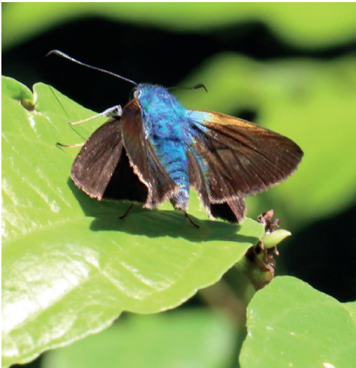
Figura 29- Onophas columbaria columbaria . Puerto Iguazú (Misiones).

Un ejemplar con alas abiertas de esta muy rara especie fue fotografiada por R. Güller en Puerto Iguazú (Misiones) el 26/8/2024 (Fig. 29) (ArgentiNat, 2025). Existe otro ejemplar procedente del mismo sitio en la colección del autor en el MACN. Se destaca su cuerpo azul metálico y faz ventral de las alas amarillentas. Hallada en el cercano Parque Nacional Iguazu, Parana, Brasil (Greve et al. , 2023). Conocida de México a Bolivia y Brasil (Warren et al. , 2024). Se trata de género y especie no citado previamente en el país.