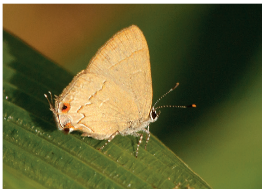
Figura 1 - Arzecla nubilum . Reserva Yabotí (Misiones).

Registrada en el Parque Nacional do Iguazu, Paraná, Brasil (Greve et al. , 2023). Propia del sur de Brasil (Warren et al. , 2024). Parecería ser más habitual en zonas altas de Misiones.