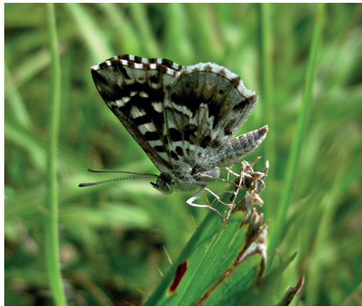
Figura 10- Aricoris schneideri . Ruinas de Santa Ana (Misiones).

gentiNat (2025) hay registros fotográficos en Santa Ana y San Pedro. El 20/2/2025 fueron hallados por el autor varios ejemplares de ambos sexos en las ruinas jesuíticas de Santa Ana, los cuales posaban en la vegetación baja de un pastizal cercano (Fig. 10). No mencionada para el país en Klimaitis et al. (2018). Presente también en el sur de Brasil y Paraguay (Siewert et al. , 2014).