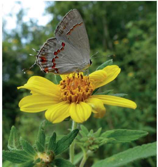
Figura 9- Strymon azuba . Dos de Mayo (Misiones).

una localidad muy posiblemente errónea. En dicho trabajo hay otros casos de especies que en realidad no parecen ser propias de esos lugares, como por ejemplo la cita de S. oreala (Hewitson, 1868) para Tucumán (y que en realidad vuela en el sur de Brasil). Dado que S. azuba es una especie propia del sur de Brasil y Paraguay (Klimaitis et al. , 2018), era esperable se hallaran ejemplares en provincias cercanas a los países mencionados. En efecto, en ArgentiNat (2025) existen varios registros de S. azuba en la provincia de Misiones, uno de ellos de la localidad de 2 de Mayo (Misiones), del 7/1/2017. (Fig. 9)