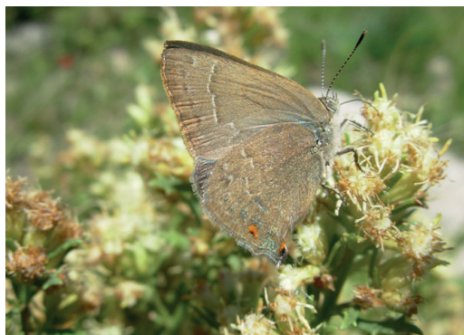
Figura 3 - Contrafacia francis . Los Cocos (Córdoba).

veterator posee azul en faz dorsal, lo cual eremica nunca tiene. (Figs. 3, 4 y 5).