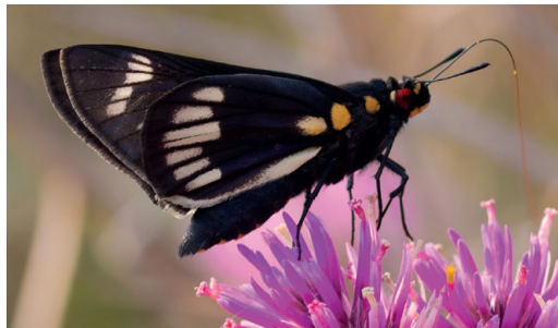
Figura 23- Carystus sylvanus . Parque Nacional Río Pilcomayo (Formosa).

propia del chaco húmedo (Klimaitis et al. , 2018). El ejemplar en cuestión posó un breve instante sobre flores de Gomphrena pulchella (Amaranthaceae) y no volvió a ser vista (A. López Oribe, com. pers.). El área en cuestión es una sabana de pastizales húmedos con presencia de islotes de monte y palmeras. Posiblemente la oruga de C. sylvanus se alimente de alguna de esas palmeras, como se deduce que ocurre en Capilla del Monte, si bien no está confirmado (Volkman y Núñez Bustos, 2013). Evidentemente el adulto debe volar por cortos períodos de tiempo en ciertas zonas, por lo que seguro también existiría en Paraguay, dada la cercanía del límite internacional al lugar de hallazgo. Anteriormente en el género Synale .