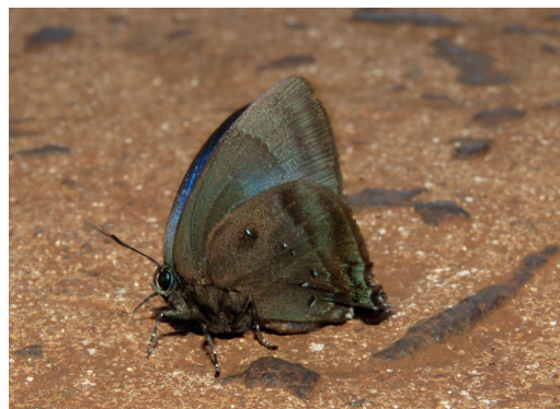
Figura 7 - Denivia silma . Puerto Iguazú (Misiones).

Recientemente se describió una nueva especie dentro del complejo lisus (Martins et al. , 2016), la cual también se halló en Misiones y se presenta en este trabajo. Se trata de Denivia silma (Martins, Faynel y Robbins, 2016), la cual es muy semejante a lisus pero más verdosa, aunque no es fácil sepa-