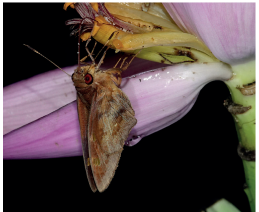
Figura 31- Talides riosa . Puerto Iguazú (Misiones).

Se trata de un nuevo registro para el país, hallada el 30/10/2023 en el jardín del Hotel Selva del Laurel, en las afueras de Puerto Iguazú (Misiones) (Fig. 31). El ejemplar parece ser una ♀. Solo se conocía a esta rara especie de Brasil y Perú (Warren et al. , 2024), aunque recientemente fue hallada en el Parque Nacional Iguazu, Parana, Brasil (Greve et al. , 2023). Muy similar a T. sinois Hübner, [1819], con la cual podría confundirse, aunque no volaría allí (Austin, 1998). De éste género en Misiones solo estaba el