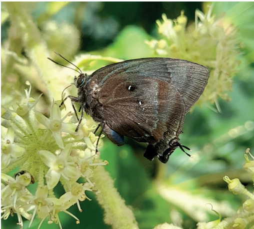
Figura 8- Denivia lisus . Santa Ana (Misiones).

A modo de comparación se presenta también una foto de D. lisus , tomada en Santa Ana (Misiones) el 9/6/2024. El ejemplar puede notarse que es mucho menos “verde” que D. silma . Está posado en flores de Fatsia japonica (Thunberg) Decne. & Planch., 1854. (Araliaceae), la cual es una planta exótica cultivada que florece en invierno. La misma atrae gran cantidad de mariposas, destacándose a veces ciertos Lycaenidae raros, como ya fuera documentado previamente (Núñez Bustos, 2023a). Conocida de México al sur de Brasil (Martins et al. , 2019). (Fig. 8)