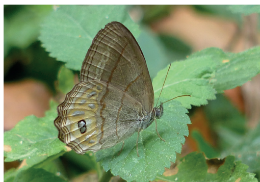
Figura 15- Argentaria pagyris . Parque Provincial Piñalito (Misiones).

En ArgentiNat (2025) hay varios registros recientes de A. pagyris en Misiones, de los que acá se presentan dos fotografías y una de A. hygina , a modo comparativo. (Figs. 15, 16 y 17)