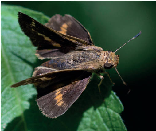
Figura 26- Metron fasciata (Faz dorsal). Puerto Ocampo (Santa Fe).

Algunos ejemplares de esta rara especie fueron fotografiados en Puerto Ocampo (Santa Fe) el 18/2/2024 (Figs. 26 y 27) y el 3/5/2025 en Villa San Vicente sobre flores de Chromolaena christiana (Baker) R.M. King & H. Rob. (Asteraceae). Tres ejemplares de la última fecha fueron recolectados. Hayward (1973) la cita como M. zimra (Hewitson, 1877) para "Argentina", sin precisar provincia ni localidad, aunque ningún ejemplar local fue hallado en las colecciones consultadas. Recientemente Zhang et al. (2022) separa a M. fasciata de zimra , ya