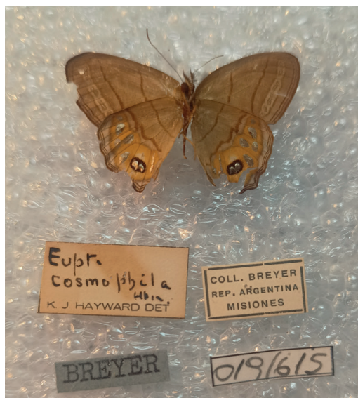
Figura 14- Argentaria pagyris . Misiones (MLP).

En la colección Breyer del MLP hay al menos un ejemplar de Misiones (determinado y rotulado por K. J. Hayward como " Euptychia cosmophila " (Hübner, 1823) (Fig. 14), lo que explica porque aparece también con ese nombre en Hayward (1958, 1967, 1973). Parece en esos años el taxón pagyris estaba sinonimizado con cosmophila (la cual no existe en Argentina), de allí la cita de ésta última en dichos trabajos. Actualmente cosmophila y pagyris son consideradas distintas especies y ambas son muy semejantes a Argentaria hygina (A. Butler, 1877), la cual es más común en Misiones y también existe en Paraguay y sur de Brasil (Klimaitis et al. , 2018). Todas ellas fueron transferidas recientemente al género Argentaria desde Splendeuptychia (Espeland et al. , 2023). En el pasado hubo confusiones entre especies de este género, como en el caso de Canals (2003, pág. 380), quien cita a cosmophila , pero en realidad la imagen se trata de hygina . Lo más probable es que ese autor confiara en el rótulo del ejemplar que decía " cosmophila ", como el ejemplar del MLP arriba aludido. Las diferencias entre ambas especies son sutiles pero en pagyris la mancha naranja en faz ventral de alas posteriores llega en