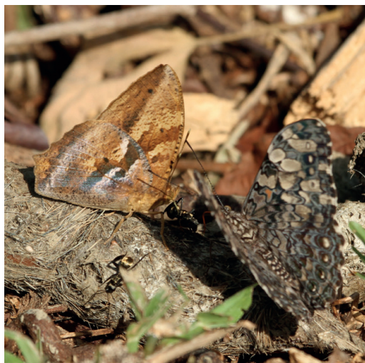
Figura 19- Narope cyllarus . Parque Nacional Iguazú (Misiones).

Recientemente algunos ejemplares fueron fotografiados in situ en Misiones (ArgentiNat, 2025, EcoRegistros, 2025). Uno de ellos se observa posado en una feca de felino junto a una Hamadryas epinome (C. Felder y R. Felder, 1867) (Bibliidinae) en el Parque Nacional Iguazú, en enero de 2020. (Fig. 19). Si bien está citada de allí (Núñez Bustos, 2009), se trata de una especie rara de ver y en el país no hay muchos ejemplares recolectados. En la colección del MACN solo hay una pareja de Iguazú. Conocida del sur de Brasil (Klimaitis et al., 2018).