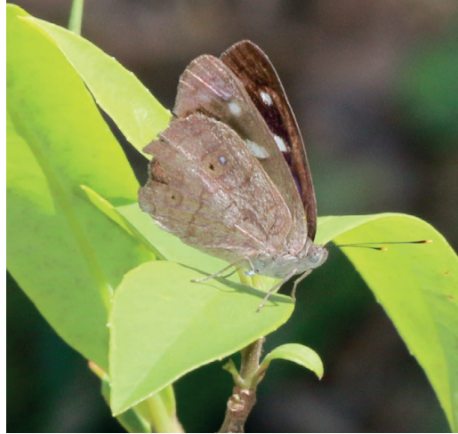
Figura 12- Eunica pusilla . Parque Nacional Calilegua (Jujuy).

trada para esa provincia. Solo se conocía un ejemplar del norte de Salta colectado por R. Eisele (Klimaitis et al. , 2018), el cual está depositado en la colección del Mc Guire Center (Florida, EEUU). Conocida de Costa Rica a Bolivia y sur de Brasil (Warren et al. , 2024).