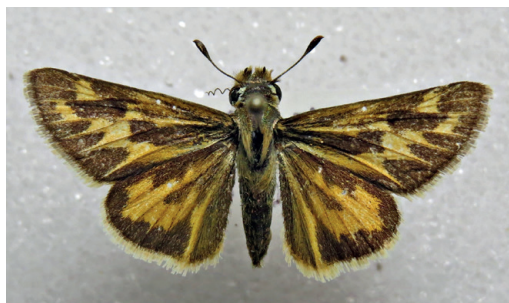
Figura 24- Hylephila isonira mima . Abra Pampa (Jujuy).

Citada por Hayward (1973) para Catamarca aunque se sospecha que este autor la confundió con H. bouletti (Klimaitis et al. , 2018) ya que no se hallaron ejemplares de isonira en las colecciones. Se constató recientemente que existe en el noroeste argentino ya que el autor la ha recolectado en Abra Pampa (Jujuy) el 12/12/2022 (Fig. 24). Conocida de Perú, Bolivia y Chile (Guerra Serrudo et al. , 2013, Warren et al. , 2024).