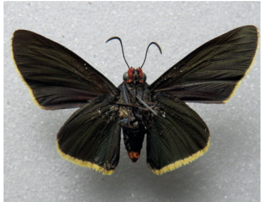
Figura 33- Microceris viriditas viriditas . San Ignacio (Misiones).

Registrada en Klimaitis et al (2018) en base a un ejemplar de San Pedro (Misiones) en la colección de Curitiba (Brasil) pero desde entonces nunca confirmada. Dado que existe un “San Pedro” en Paraguay, con lo que la procedencia real del ejemplar podía ser errada. No obstante, un ejemplar reciente de San Ignacio (Misiones) se ha confirmado (Fig. 33). Es muy semejante a Pyrrhopyge pelota Plötz, 1879 pero la patagia es negra en vez de roja y las orlas amarillas parecen más angostas. Conocida de Bolivia y Paraguay (Mielke et al. , 2022).