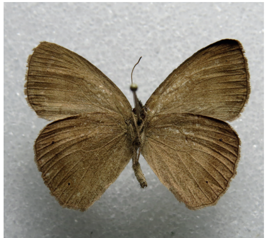
Figura 18- Yphthimoides inornata . Arroyo Coatí (Misiones).

Un ejemplar de esta especie recientemente revalidada (Piovesan et al. , 2022) fue hallado en la colección del autor (MACN) mezclado con ejemplares de Malaveria affinis (A. Butler, 1867). El mismo procede del sur de Misiones (Arroyo Coatí y Ruta 14, departamento Capital, 16/9/2007, leg. R. Güller) (Fig. 18). En Argentina solo tenía