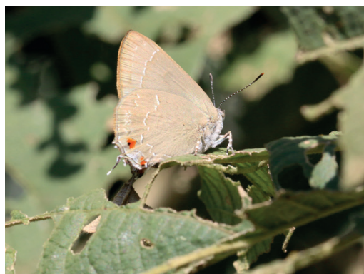
Figura 2 - Contrafacia catharina . Puerto Iguazú (Misiones).

Se trata de una especie inédita para el país, muy similar a C. imma (Prittwitz, 1865) pero de colorido más claro en faz ventral y sin la marca discal en faz ventral de alas posteriores (Orlandin et al. , 2020). Registrada en el Parque Nacional do Iguazu, Paraná, Brasil (Greve et al. , 2023). Propia del sur de Brasil (Warren et al. , 2024).