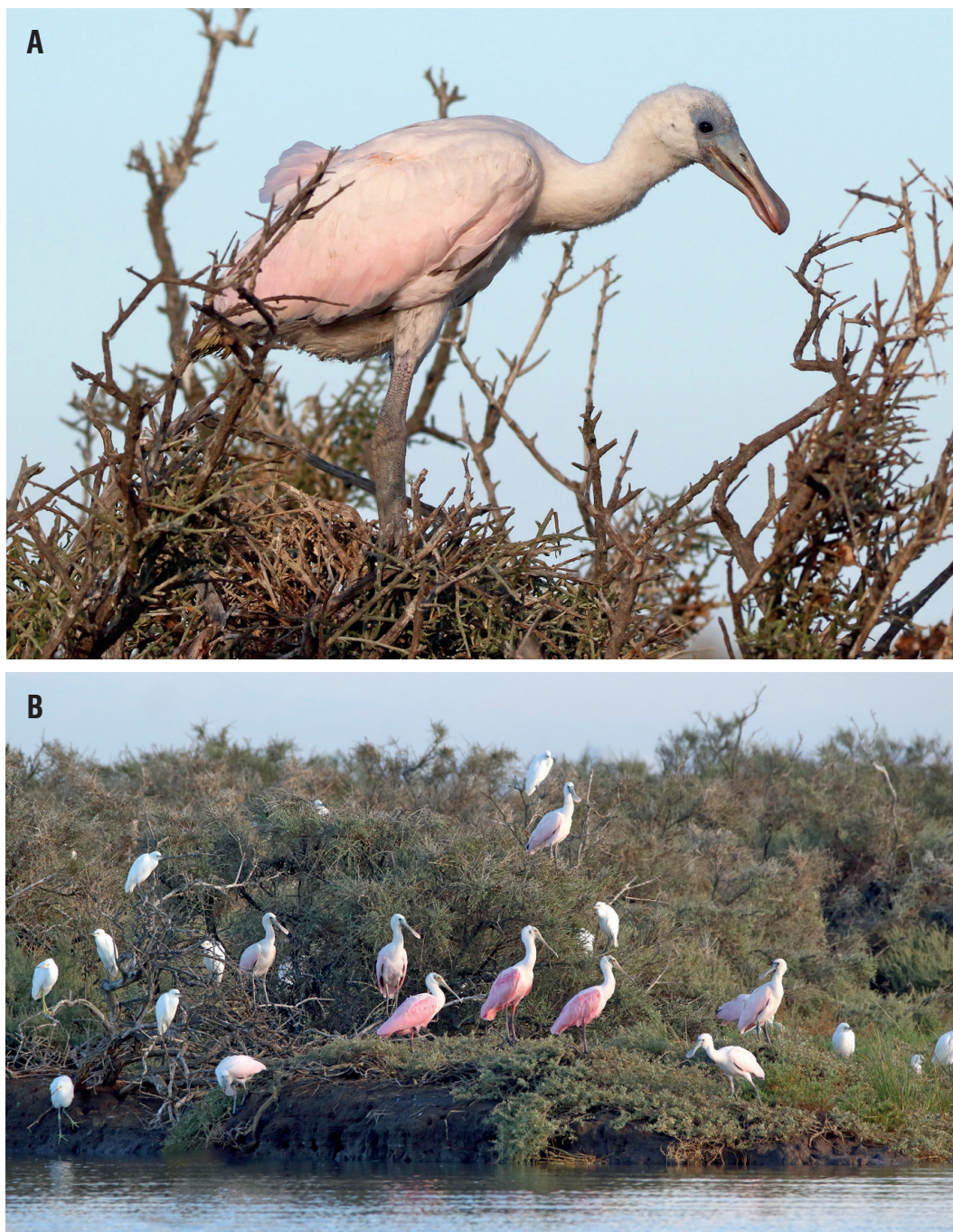
Figura 4- A , Pichón de P. ajaja de aproximadamente 25–30 días de edad, fotografiado en la colonia de Golfada Chica el 3 de febrero de 2022; B , juveniles voladores junto a adultos, distinguibles por la coloración general más pálida y el menor tamaño del pico.