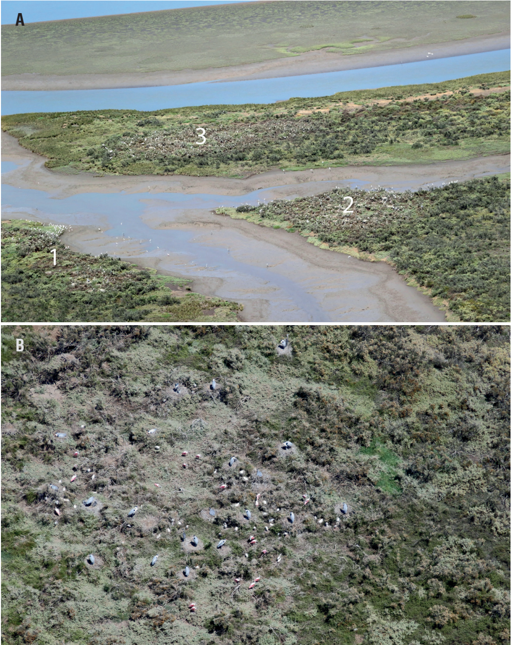
Figura 2- A , Imagen aérea de las tres subcolonias mixtas de P. ajaja , Ardea cocoi , Egretta thula y Bubulcus ibis registradas en febrero de 2022 en la zona de la Golfada Chica (indicadas como 1, 2 y 3); B , imagen aérea en mejor detalle de una subcolonia durante el mes de noviembre de 2022, donde también se aprecian nidos de Ardea cocoi y Bubulcus ibis .