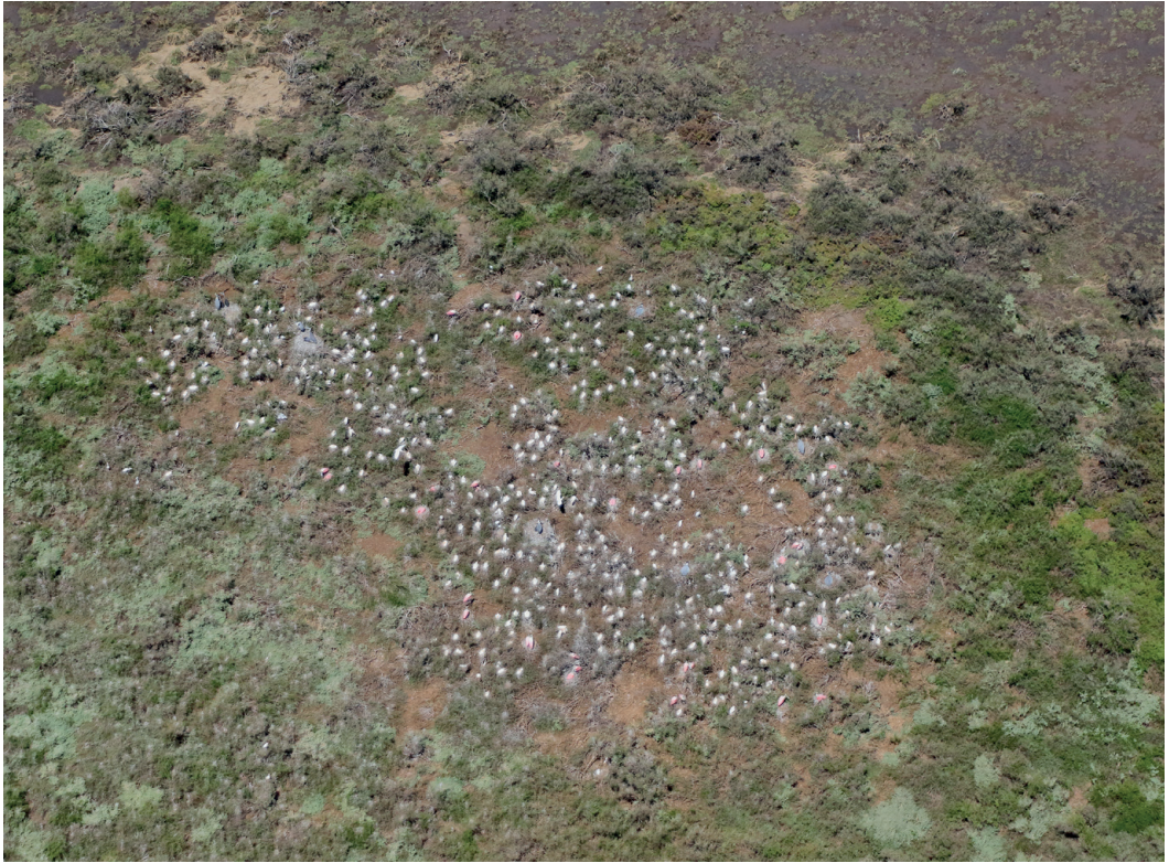
Figura 3- Imagen aérea de la colonia mixta de P. ajaja , Ardea cocoi , Egretta thula y Bubulcus ibis , registrada en diciembre de 2023 en el islote Los Pichones.

to estaba cubierto por marismas de jume ( Sarcocornia perennis ) y espartillo ( Sporobolus densiflorus ), entre otras. Todas las colonias estuvieron ubicadas en islotes y cerca de la orilla, la distancia mínima al agua fue de 1 m, 6 m y 9 m en las subcolonias de la Golfada Chica y de unos 80 m en la colonia de Los Pichones.